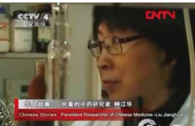
▲ 2012年4月12日中央電視台“華人世界”節目報道。

這突如其來的疾病讓她震驚、痛苦，也讓她對自己過去的研究和未來方向有了新的思考。希望將自己的學識和研究成果更緊密地結合到臨床實踐中去，用中醫藥去幫助人們預防和治療疾病。親歷的病痛，堅實的學術底蘊和善良的品格組合出強烈的使命感，她做出人生轉向的選擇。經過反覆思考，她認為人生短暫，應該在有限的生命中做出無限的貢獻。中醫藥是她的理想和事業，如果將愛好和特長結合到工作中，將是最大的快樂和成就。在得到了家人的理解與支持後，她就辭別了公務員生涯，籌建診所，開始了人生中的一個新里程。