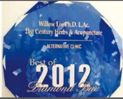
▲ 2012年被評為鑽石吧市最佳替代療法診所。